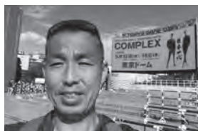
COMPLEXのチャリティライブにて

あまやどり新聞の第1号お楽しみ頂きましたでしょうか。最近、高3長女は大学受験を控えてピリピリ期。高1次女は吹奏楽部でチューバに挑戦！小6長男は毎日ひたすらスマホゲーム